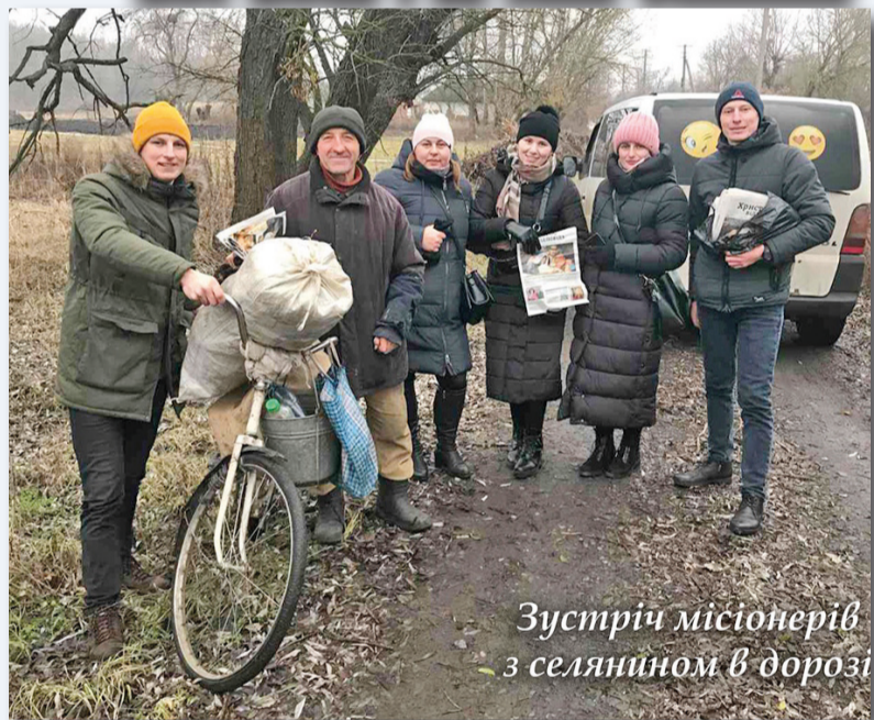
Зустріч місіонерів з селянином в дорозі

«Отже, виправдавшись вірою, маємо мир з Богом через нашого Господа Ісуса Христа, через Якого ми вірою одержали доступ до тієї благодаті, в якій перебуваємо і хвалимося надією на Божу славу» (Рим. 5:1-2).