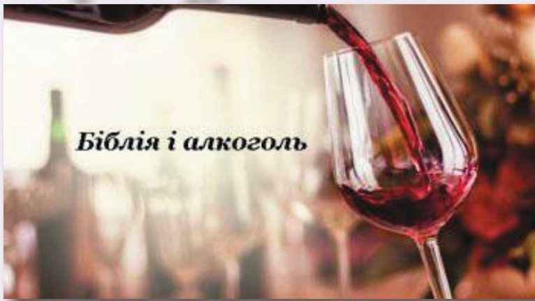
Біблія і алкоголь

Алкоголь формує звичку і залежність. А християнин повинен уникати усього, що ставить його в залежність і веде до