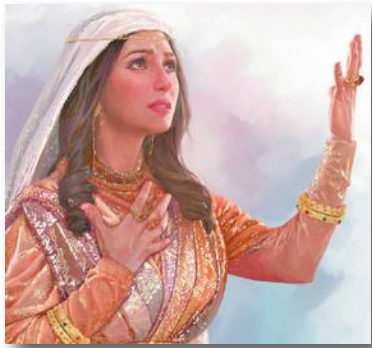
Найбільш значуща подія в єврейській історії

Серед багатьох книг Біблії особливе місце посідає книга Естер. І хоча щодо неї точилися суперечки багатьох дослідників і богословів, книга Естер була включена до Біблії і завдяки їй ми дізнаємося про свято Пурім і його історію.