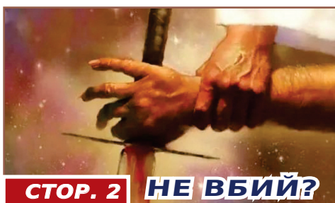
СТОР. 2 НЕ ВБИЙ?