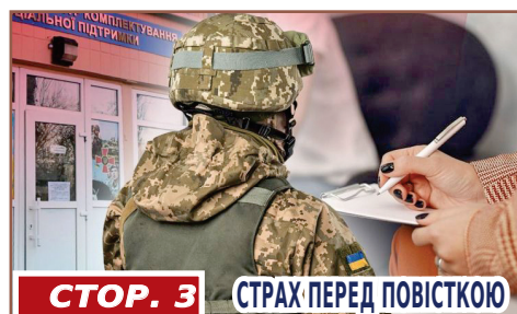
СТОР. 3 СТРАХ ПЕРЕД ПОВІСТКОЮ