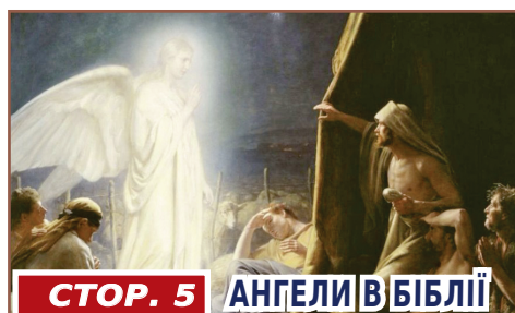
СТОР. 5 АНГЕЛИ В БІБЛІЇ