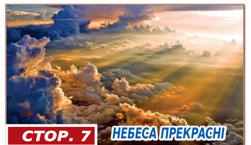
СТОР. 7 НЕБЕСА ПРЕКРАСНІ