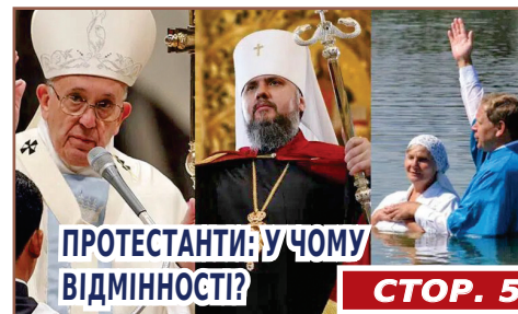
ПРОТЕСТАНТИ: УЧОМУ ВІДМІННОСТІ?