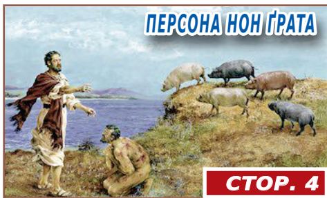
ПЕРСОНА НОН ГРАТА