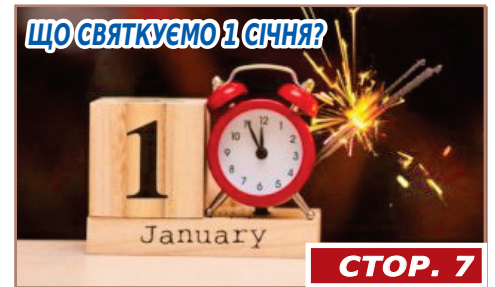
ЩО СВЯТКУЄМО 1 СІЧНЯ?