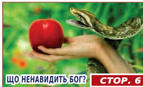
ЩО НЕНАВИДИТЬ БОГ?