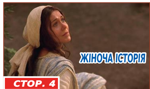
ЖІНОЧА ІСТОРІЯ СТОР. 4