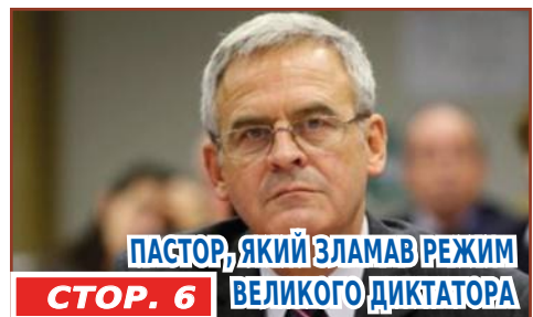
ПАСТОР, ЯКИЙ ЗЛАМАВ РЕЖИМ ВЕЛИКОГО ДИКТАТОРА СТОР. 6