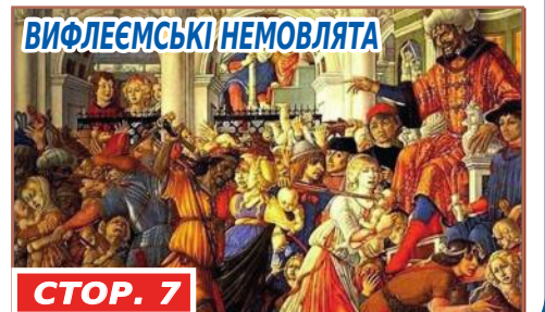
ВІФЛЕЄМСЬКІ НЕМОВЛЯТА СТОР. 7

«І вона вродить Сина, ти ж даси Йому ймення Ісус, бо спасе Він людей Своїх від їхніх гріхів» (Матвія 1:21).