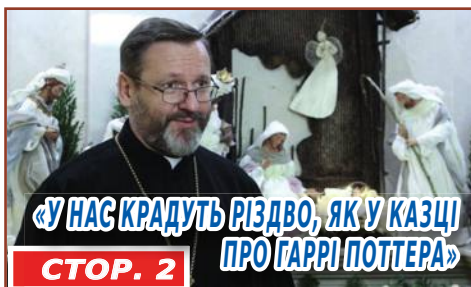
«У НАС КРАДУТЬ РІЗДВО, ЯК У КАЗЦІ ПРО ГАРРІ ПОТТЕРА» СТОР. 2