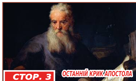
СТОР. 3 ОСТАННІЙ КРИК АПОСТОЛА