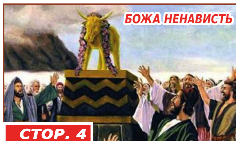
СТОР. 4 БОЖА НЕНАВИСТЬ