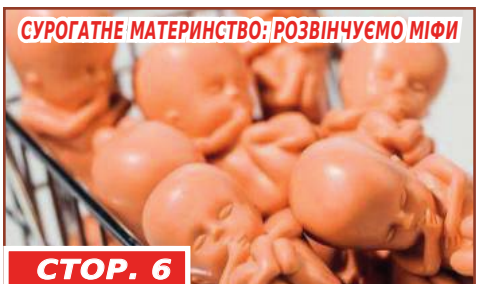
СТОР. 6 СУРОГАТНЕ МАТЕРИНСТВО: РОЗВІНЧУЄМО МІФИ