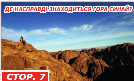
СТОР. 7 ДЕ НАСПРАВДІ ЗНАХОДИТЬСЯ ГОРА СІНАЙ?

«Один бо є Бог, і один Посередник між Богом і людьми – Людина Христос Ісус, що дав Самого Себе за викуп для всіх» (Перше послання св. апостола Павла до Тимофія 2:5).