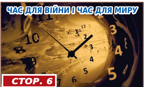
ЧАС ДЛЯ ВІЙНИ І ЧАС ДЛЯ МИРУ