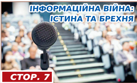
ІНФОРМАЦІЙНА ВІЙНА: ІСТИНА ТА БРЕХНЯ