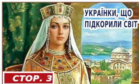
УКРАЇНКИ, ЩО ПІДКОРИЛИ СВІТ