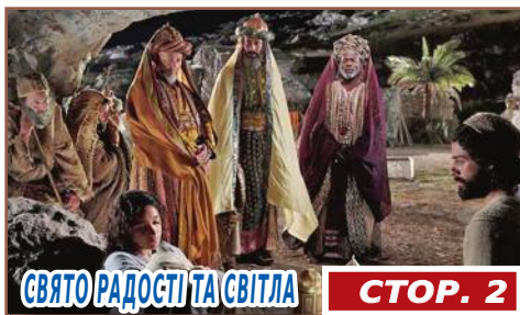
СВЯТО РАДОСТІ ТА СВІТЛА