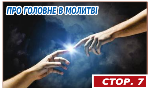
ПРО ГОЛОВНЕ В МОЛИТВІ