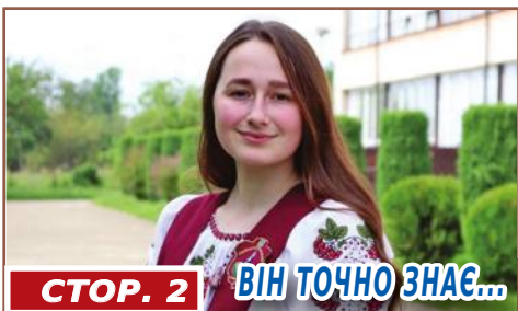
СТОР. 2 ВІН ТОЧНО ЗНАЄ...