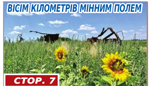
ВІСІМ КІЛОМЕТРІВ МІННИМ ПОЛЕМ