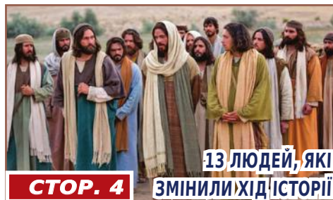
13 ЛЮДЕЙ, ЯКІ ЗМІНИЛИ ХІД ІСТОРІЇ