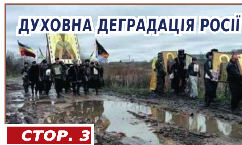
ДУХОВНА ДЕГРАДАЦІЯ РОСІЇ