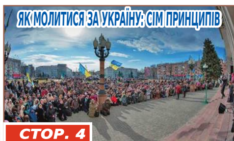
ЯК МОЛИТИСЯ ЗА УКРАЇНУ: СІМ ПРИНЦИПІВ