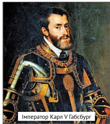
Імператор Карл V Габсбург