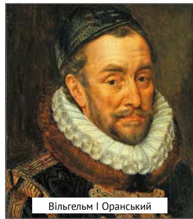
Вільгельм I Оранський