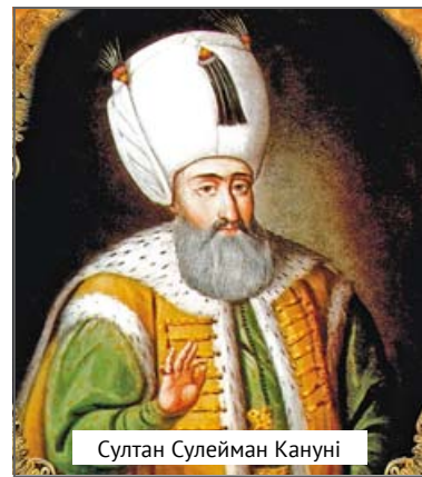
Султан Сулейман Кануні